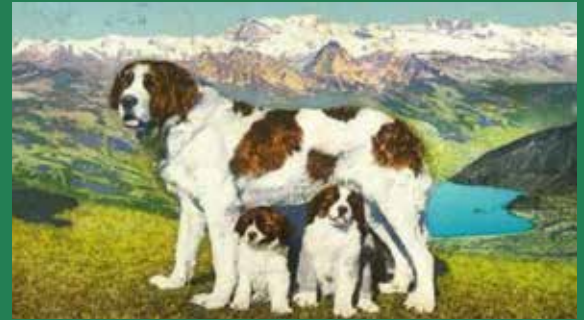
Bernhardiner auf Rigi-Kulm, 1913

RIGI BARRY & FRIENDS, gegründet im April 2018, ist ein gemeinnütziger Verein für Bernhardiner Hunde und deren Freunde und bringt den Schweizer Nationalhund wieder auf die Königin der Berge, wo er bereits anfangs dieses Jahrhunderts erfolgreich gezüchtet wurde. Der letzte Rigi-Bernhardiner starb im Jahr 1994. Bernhardiner sind sehr menschenorientiert und zeigen aussergewöhnliche Fähigkeiten im Rahmen von Sozial- und Therapieeinsätzen. Wir möchten dieses grosse Potential nutzen, und setzen unsere Hunde hierfür aktiv ein. Unvergessliche Begegnungen zwischen Bernhardinern und Menschen sind der Lohn für unseren täglichen Einsatz. Bernhardiner sind Teil unserer Schweizer Kultur und ein Symbol für unser Land in der ganzen Welt. Die Termine für unsere Barry-Wanderungen 2019 stehen fest und sind direkt auf der Rigi-Webseite ( www.rigi.ch/Bernhardiner ) buchbar. Nebst diesen Wanderungen für Individual-Gäste verbuchen wir schon heute zahlreiche Gruppen-Anfragen (Touristen, Schulklassen und Unternehmen) für dieses vielversprechende Jahr.